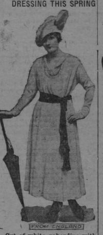
Out of white gaberdeine with sent in sleeves, slit pockets and a V neck, this one-piece gown of English demureness is smart, with its sash of crimson silk heavily trasselled. About the armscyes and neck is a bit of hand embroidery in crimson, and the tunic is white crinol.roy.

With a turban wreathed by spring flowers in pastel shades is worn this new veil, the stripes being draped horizontally. This novelty comes by the yard in all gay, modish shades and is popular for sports and motoring.